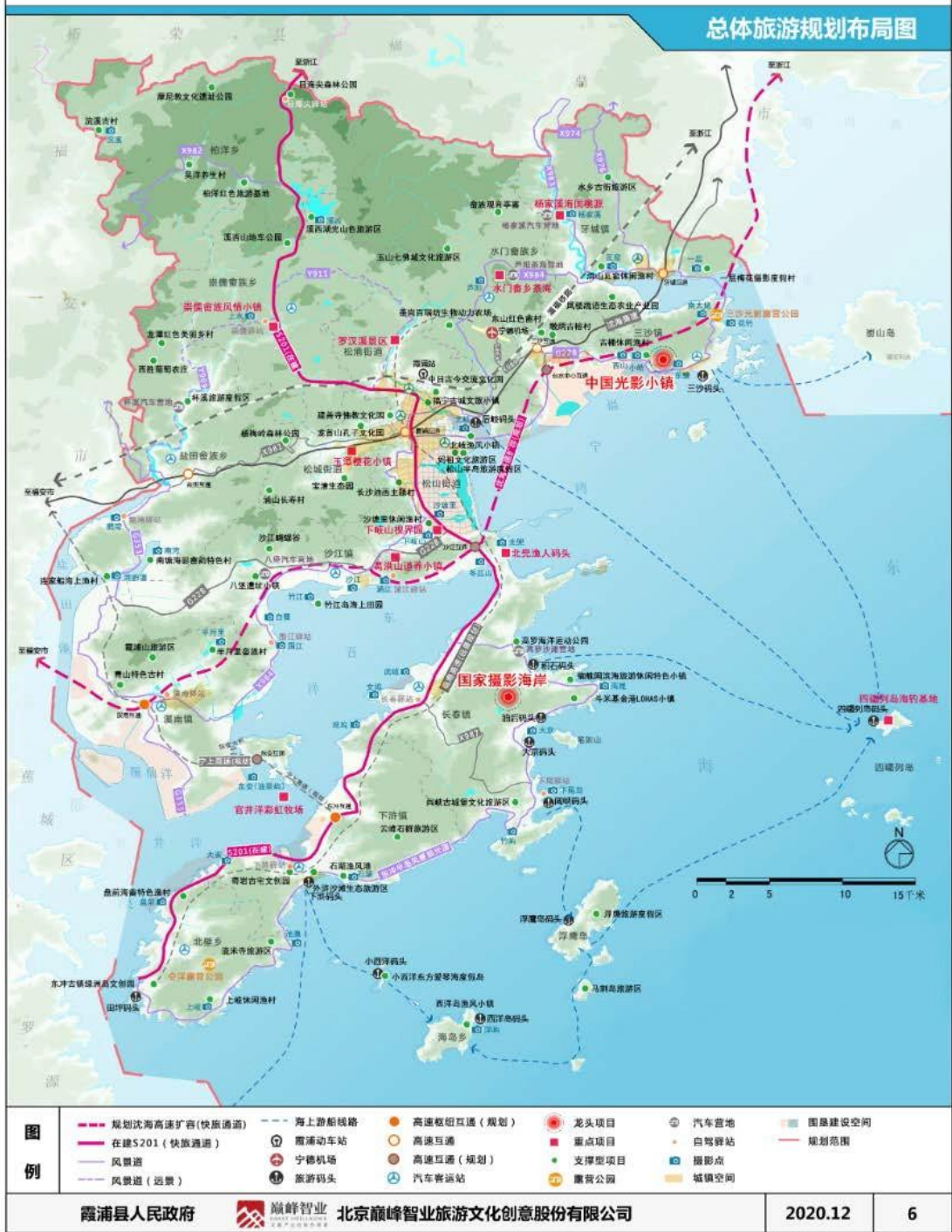
图 5. 霞浦县全域旅游规划布局图

COMPREHENSIVE TOURISM DEVELOPMENT PLAN FOR XIAPU COUNTY