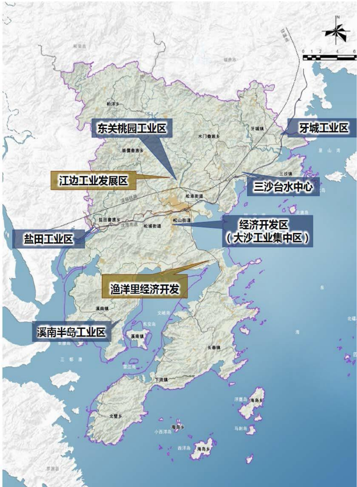
图 2. 县域产业园区布局规划图