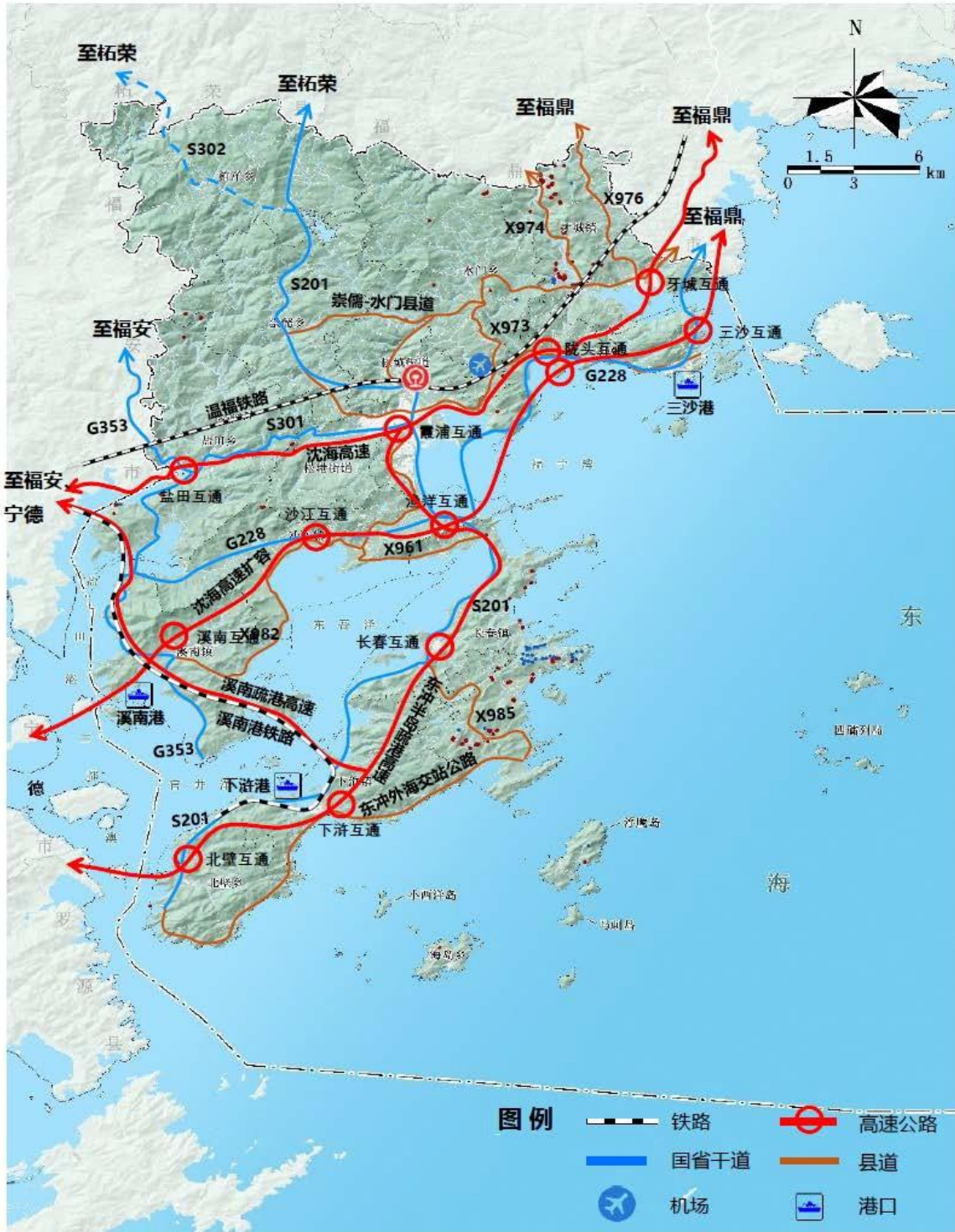
图 6. 县域综合交通规划布局图