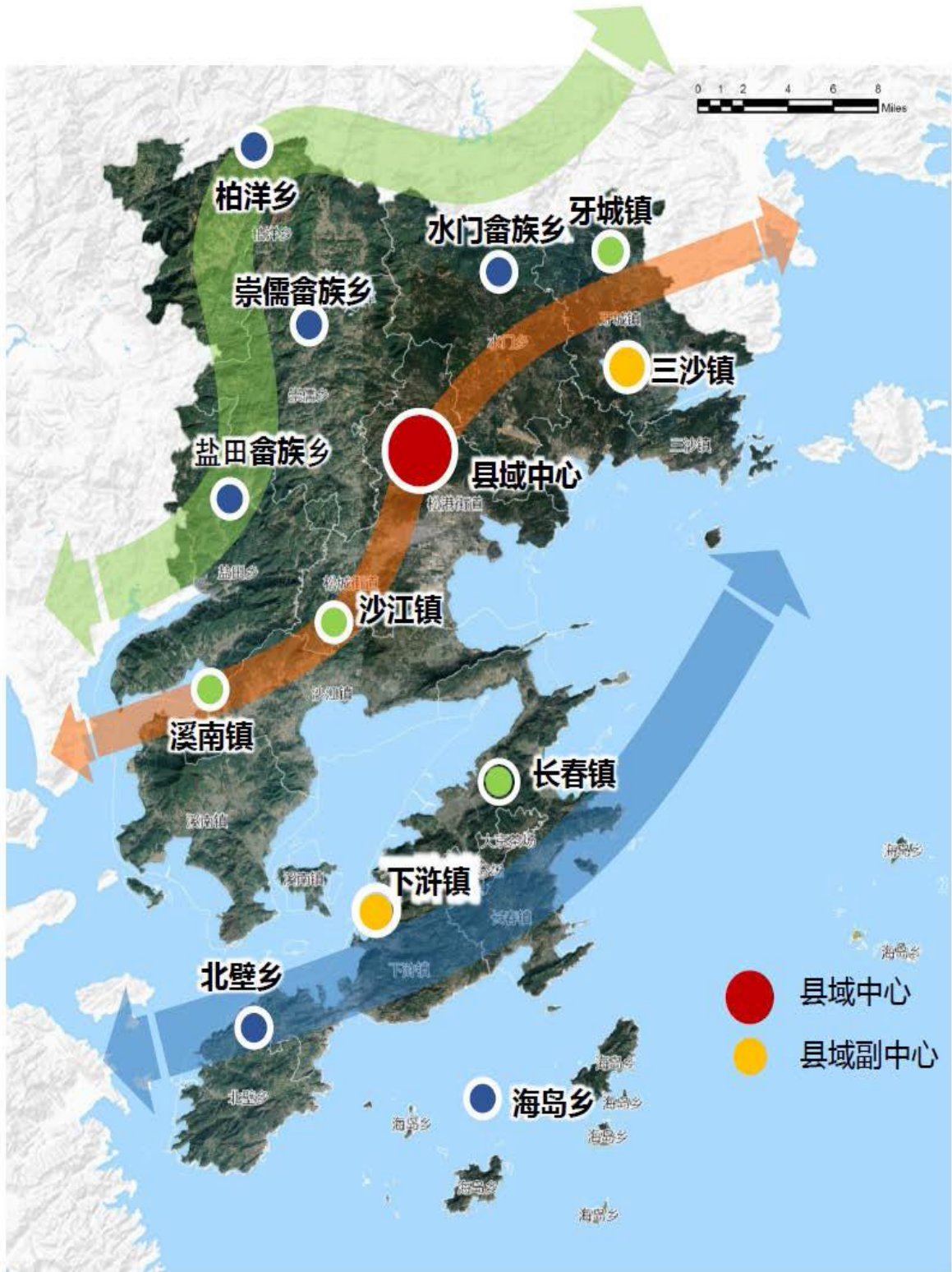
图 1. 县域城镇格局图