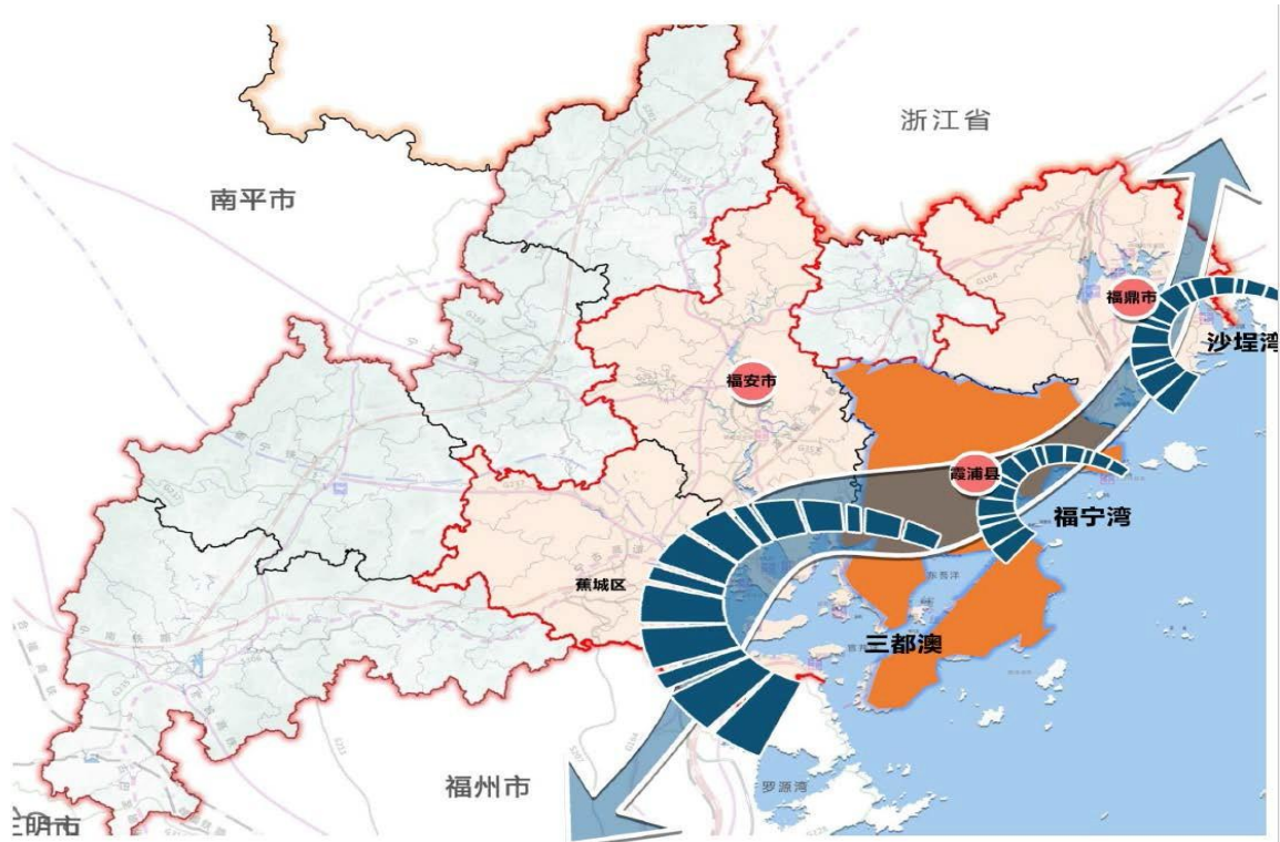
图 3. 福宁湾—蓝色经济产业湾